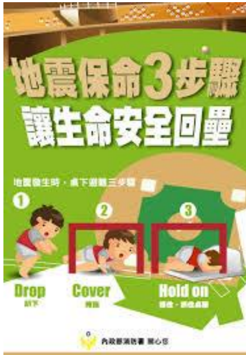
附件一 ：地震緊急避難防護動作示意圖