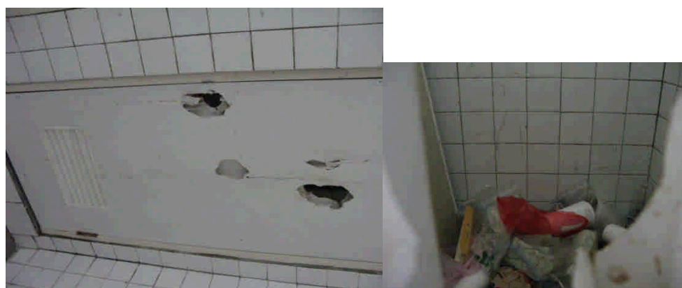
門把及內部損壞造成垃圾死角