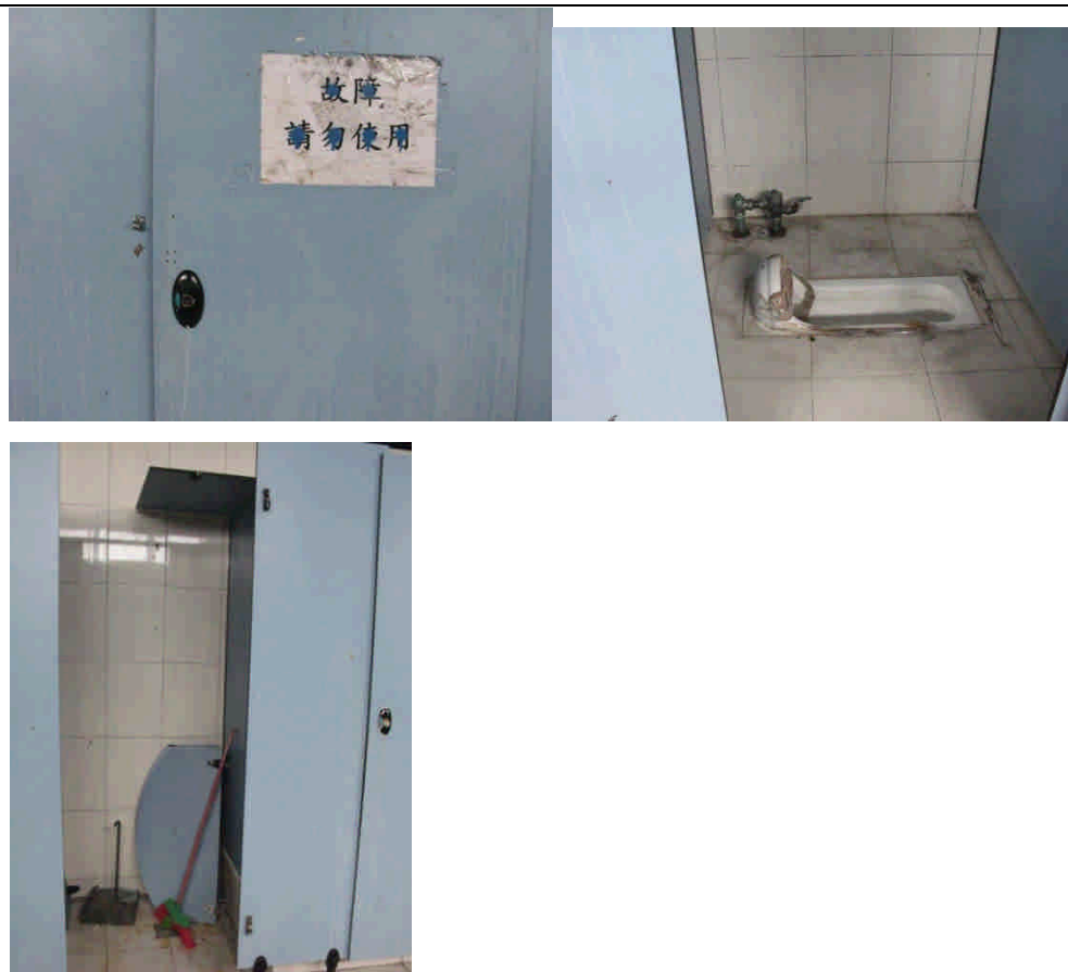
精勤樓 3 樓男廁(一間故障、置物門損壞)