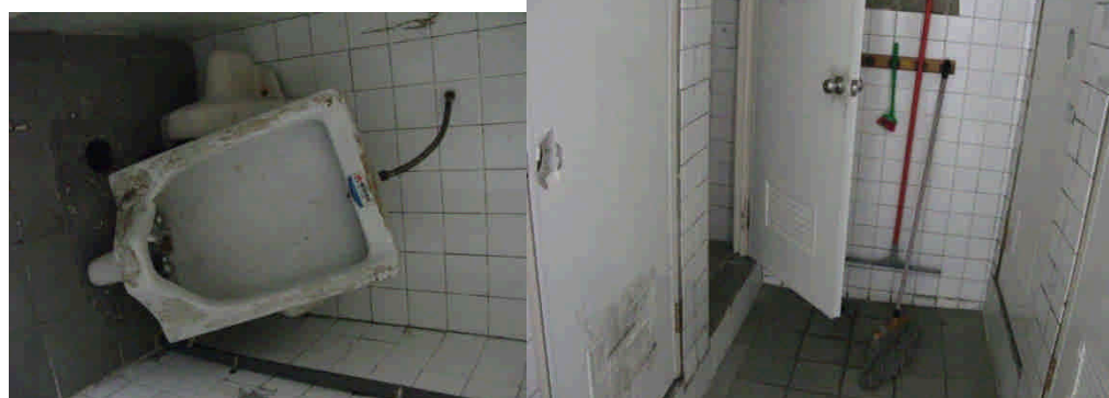
門把損壞及一間故障(誠樸樓男廁 2 樓男廁)